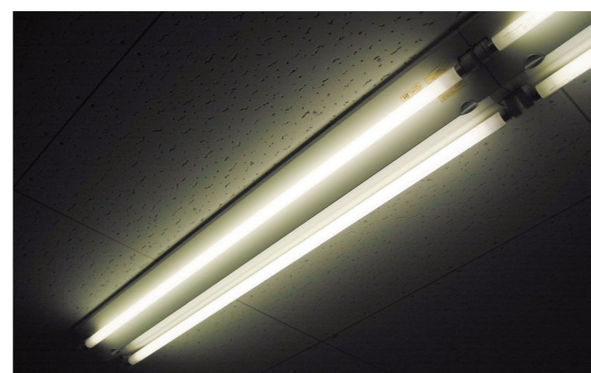
業務用・施設用蛍光灯の安定器